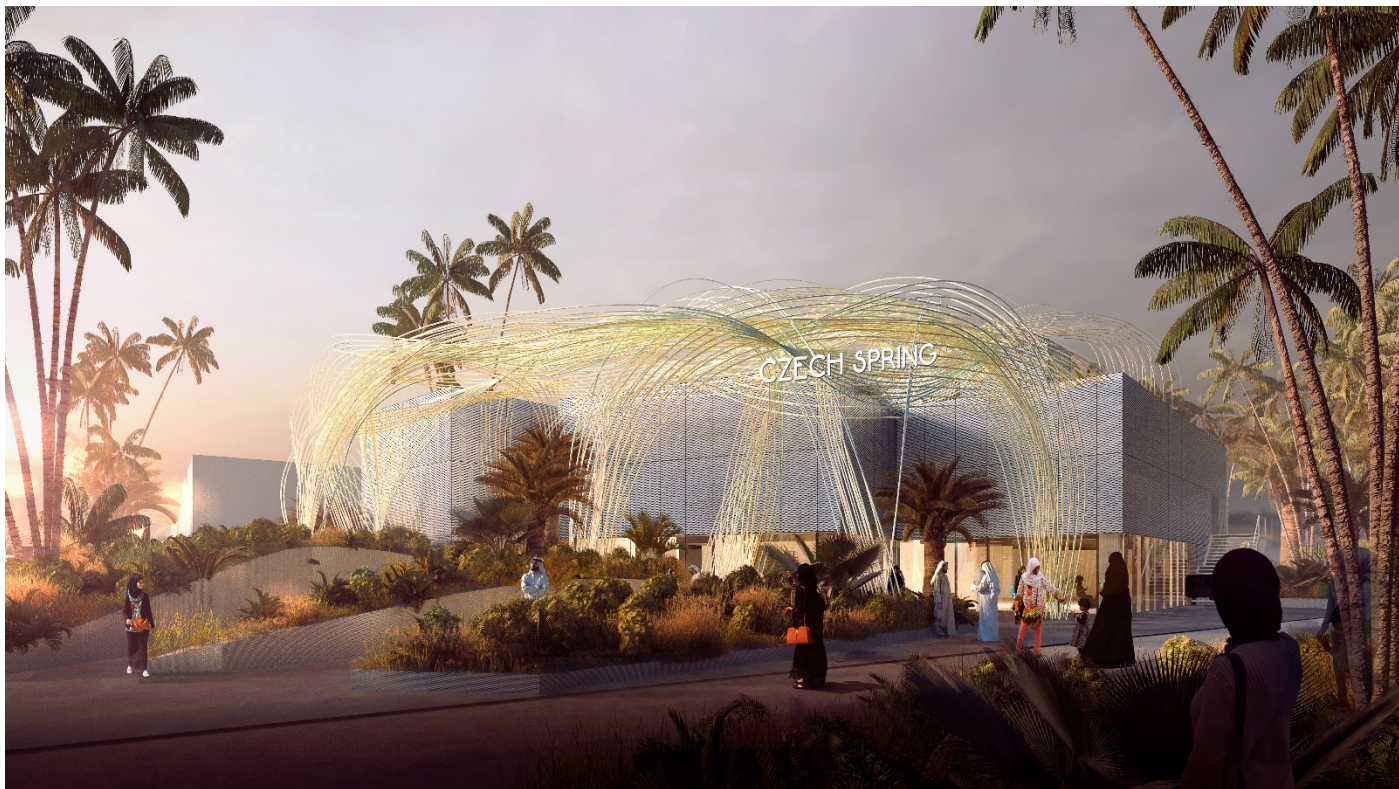
Vizualizace pavilonu České republiky