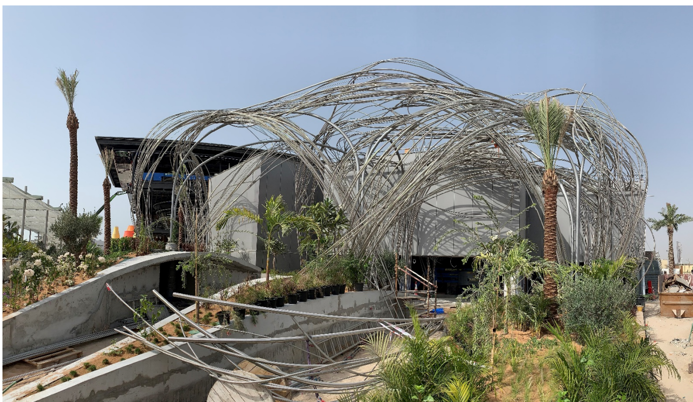
Stav pavilonu k 21.03.2021